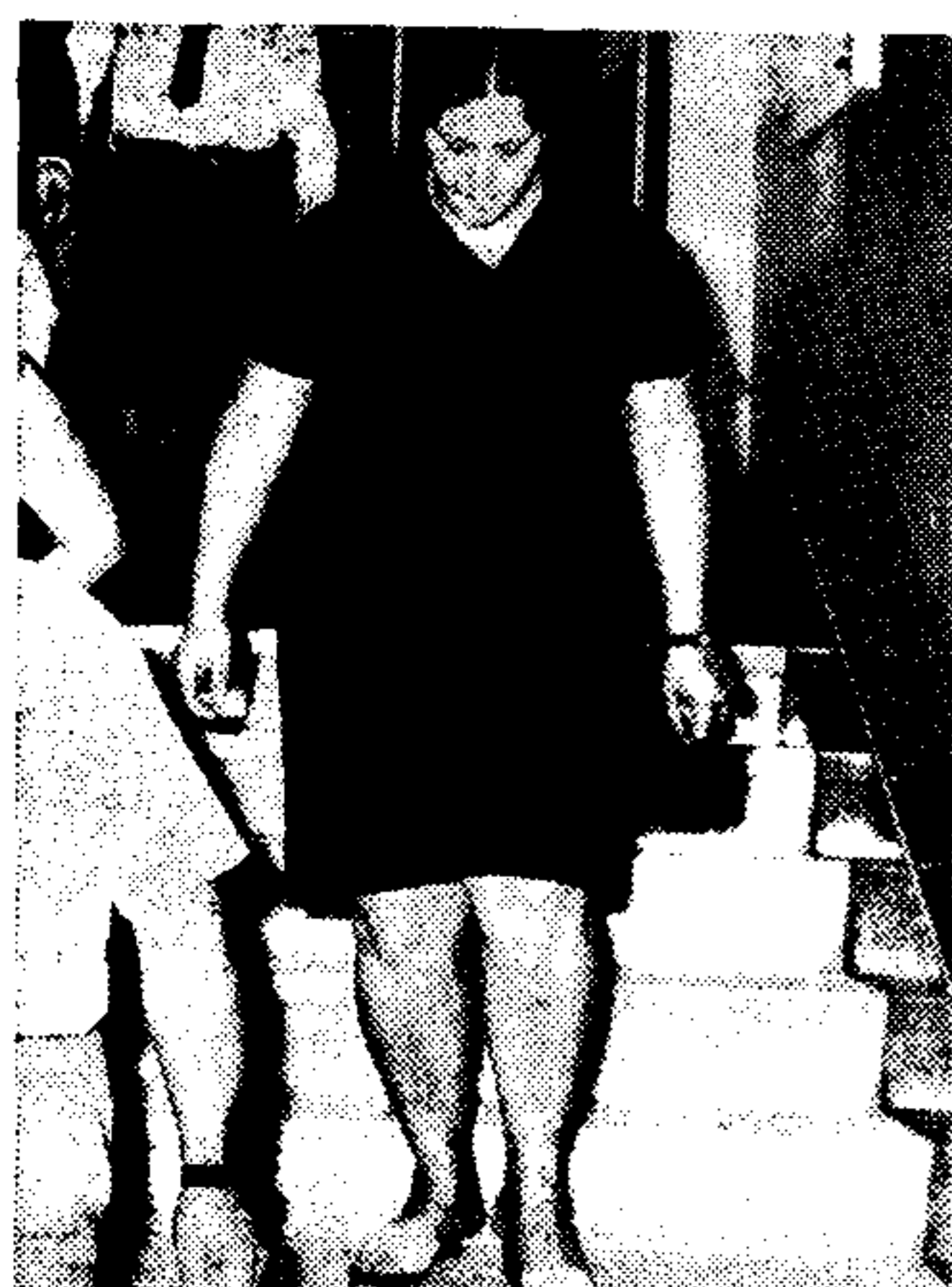
Εύθυμα και σοβαρά