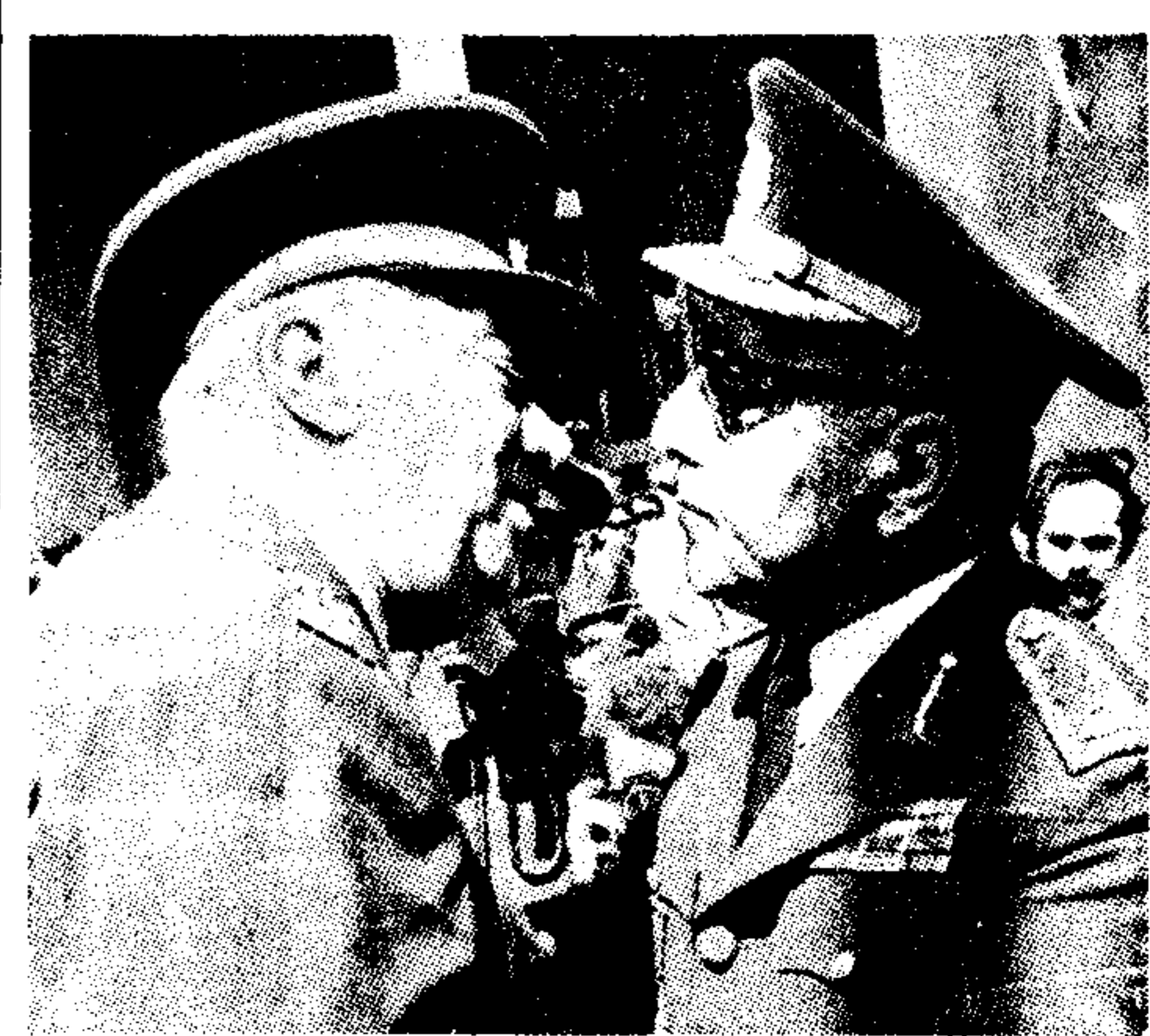
Έναγκαλισμοί και άσπασμοί στην ηγασία του τουρκικού στρατού...